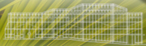
Image 3 - Collection: Rheede tot Draakestein, H. A. v. - s.n. / n°SIB 94090/1